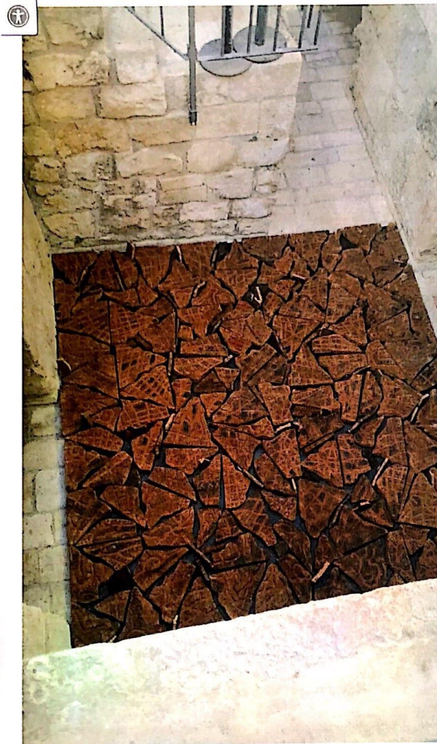
Avner Sher / 950 sq.m.: Alternative Topographies

Sher's works are made of sheets of cork, material charged with multilayered meanings. The cork is the external bark of the cork tree, peeled off once every nine years, thus creating repetitive trauma for the trees. The trees' capacity for rejuvenation, the cork's resilience to fire (like the burning bush which was not consumed) has made cork Sher's preferred material