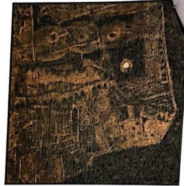
Avner Sher Jerusalem 950 sqm no 2 153x153

מפות ירושלים וספוליה הן שתי סדרות המוצגות במבנה האדום, ומתייחסות לאדריכלות הממשית והמדומינת של העיר, לסבך הכמיהות והזעם שנמסכו בה. תר אחר מפות העיר מתקופות ומקומות שונים, חלקן מוכרות כמו 'מפת מידבא' מהמאה השישית והשביעית; וחלקן אזוטריות. הוא משוטט בין תפיסות ירושלים השונות ומצליב תחושות, אקסיומות דתיות, מידע היסטורי ואסוציאציות אישיות, לכדי תיאור היברידי של חי ודומם, הנע בין תקופות שונות מהעבר, אוטופיות ודיסטופיות. בחצר פנימית המובילה מהמרפסות למגדל המרכזי, נגלית לעיני הצופים עבודת רצפה גדולה עשויה גושי שעם, המצטרפים יחד למפה מרוסקת שחלקיה התערבבו אלה באלה, כאילו יד נעלמה קרעה אותם ופיזרה לרוח את הקרעים. זו מפה שהמתבונן יזהה בה רמזים למבנים ולאזורים מוכרים, אך הם אינם מתחברים יחד לכדי תמונה קונקרטייה.